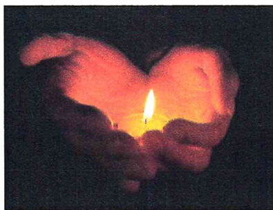
Jézus irgalmas szeretetéből van gyógyulás

A tünetek sokfélék: szorongás, harag, düh, önvád, csökkent önértékelés, vetélés, meddőség, alvászavarok, függőség (alkohol, drog), depresszió, öngyilkossági készletés. A terhességmegszakítás után a párkapcsolatok 40-50 %-a tönkremegy.